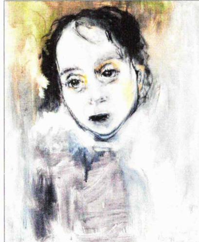
Manon Heupels Gemälde „und sie legten den Blumen Handschellen an“.